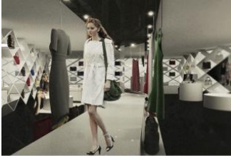
JINGYING LUXURY SHOP 金鹰精品店